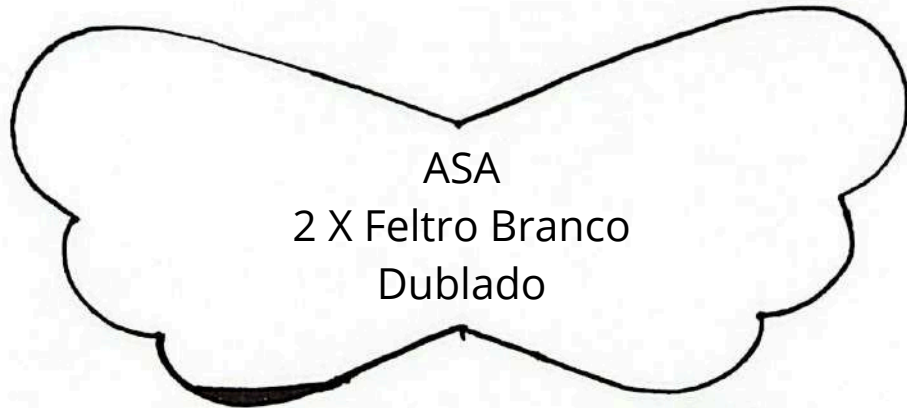
ASA 2 X Feltro Branco Dublado