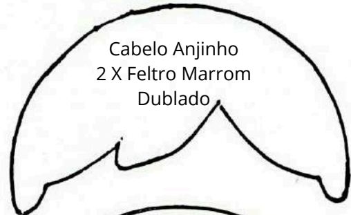
Cabelo Anjinho 2 X Feltro Marrom Dublado