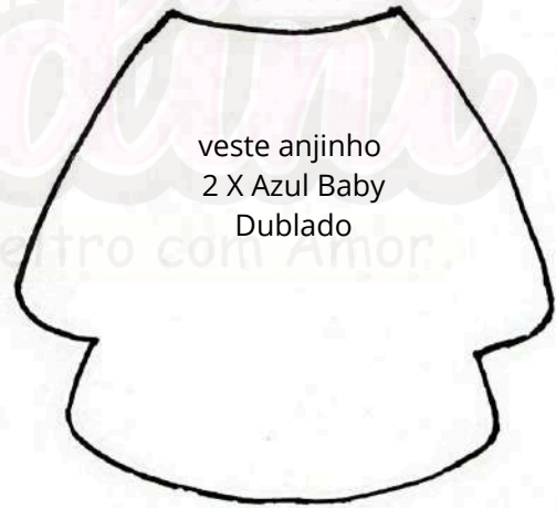
veste anjinho 2 X Azul Baby Dublado