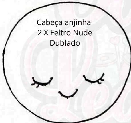
Cabeça anjinha 2 X Feltro Nude Dublado