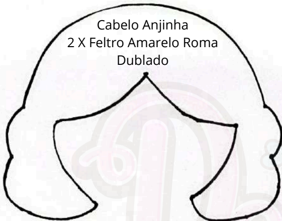
Cabelo Anjinha 2 X Feltro Amarelo Roma Dublado