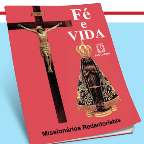
Livro Fé e Vida