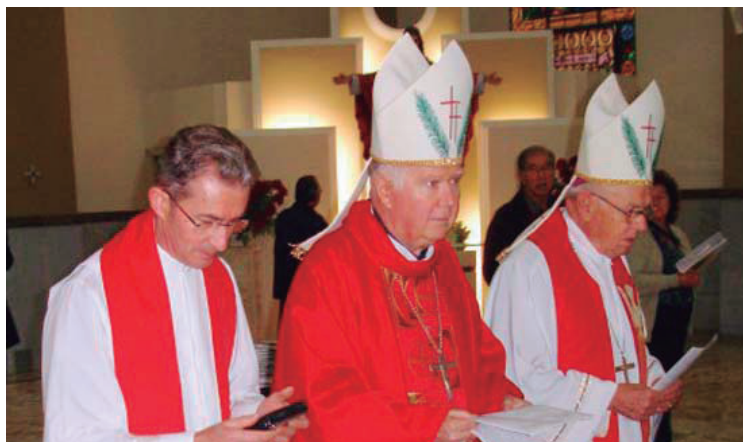
Ao Centro - Dom Pedro Ercílio Simon

No final, a cidade e as paróquias foram consagradas a Nossa Senhora, renovando o pedido para que ela continue sendo a Estrela da Evangelização, conduzindo o povo no caminho da perseverança e da santificação.