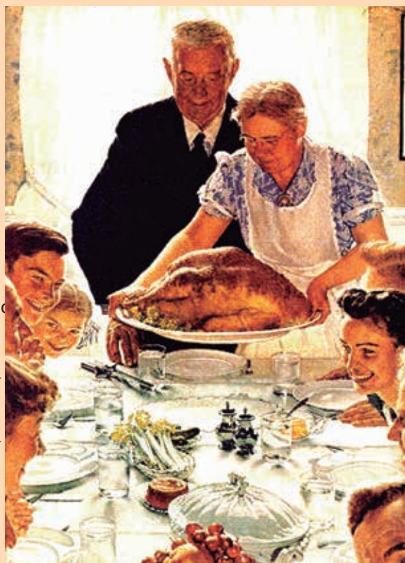
Dia Nacional de Ação de Graças

“Ação de graças” e “gratidão” fazem parte dos sentimentos e atitudes mais nobres cultivados ao longo de toda a história da humanidade. São também sentimentos e atitudes centrais presentes na orientação básica de todas as religiões. Quem ainda não fez a experiência de sentir-se grato por alguma coisa?