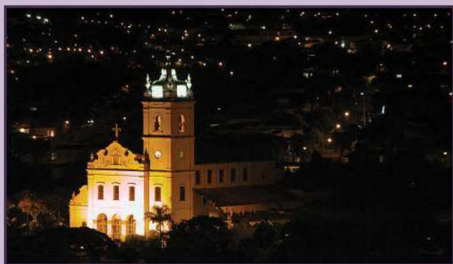
Matriz de N. Sra. do Perpétuo Socorro - São João da Boa Vista

Nossa tradicional novembrada com os estudos missionários será realizada entre os dias 13 e 28 de novembro em nossa Casa Missionária de São João da Boa Vista . O retiro dos missionários, com a presença de todos os que desejarem participar, acontecerá na Casa dos Assuncionistas em Espírito Santo do Pinhal. Os confrades de outras frentes pastorais que desejarem fazer conosco seu retiro poderão participar.