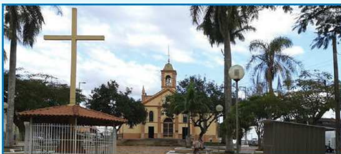
Monte Belo - Praça e Matriz