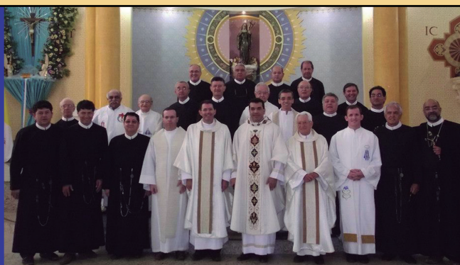
Missões de Mineiros, GO - 1975, e equipe atual em Sta Rita do Sapucaí, MG - 2012